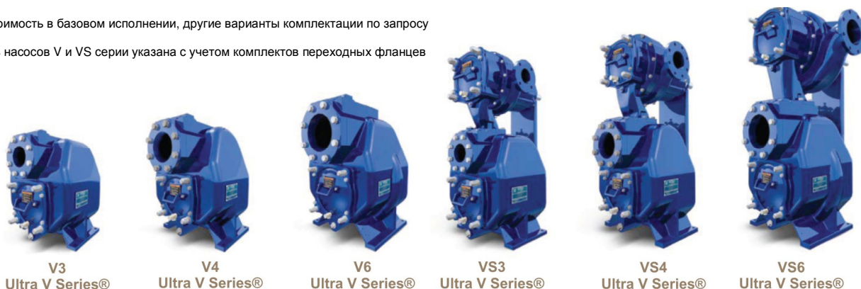
V3 Ultra V Series® V4 Ultra V Series® V6 Ultra V Series® VS3 Ultra V Series® VS4 Ultra V Series® VS6 Ultra V Series®

** - стоимость насосов V и VS серии указана с учетом комплектов переходных фланцев