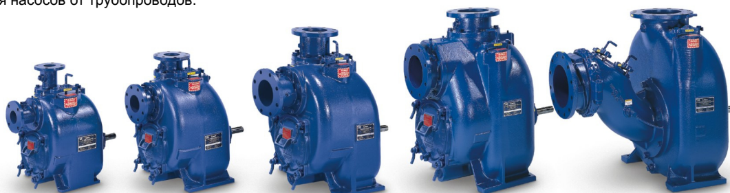
T3 Super T Series® T4 Super T Series® T6 Super T Series® T8 Super T Series® T10 Super T Series®

Насосы Super T Series и Ultra V Series обладают рядом безусловных преимуществ. В случаях открытого водозабора, насосы работают без предварительного заполнения и обратного клапана на всасывающей линии, обеспечивая высоту всасывания до 7,5 метров. Насосы предназначены для перекачивания чистых, либо загрязненных жидкостей, в том числе содержащие твердые включения до 75 мм. В качестве привода насоса стандартно используются двигатели российского производства. Конструкция насосов Super T и Ultra V позволяет проводить профилактические работы любой степени сложности без отсоединения насосов от трубопроводов.