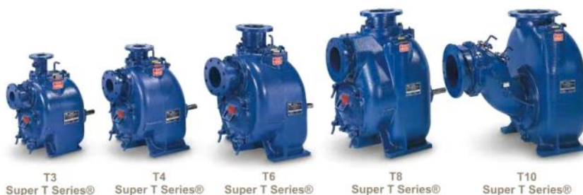
Насосы и агрегаты

Насосы Super T Series и Ultra V Series обладают рядом безусловных преимуществ. В случаях открытого водозабора, насосы работают без предварительного заполнения и обратного клапана на всасывающей линии, обеспечивая высоту всасывания до 7,5 метров. Насосы предназначены для перекачивания чистых, либо загрязненных жидкостей, в том числе содержащие твердые включения до 75 мм. В качестве привода насоса стандартно используются двигатели российского производства. Конструкция насосов Super T и Ultra V позволяет проводить профилактические работы любой степени сложности без отсоединения насосов от трубопроводов.