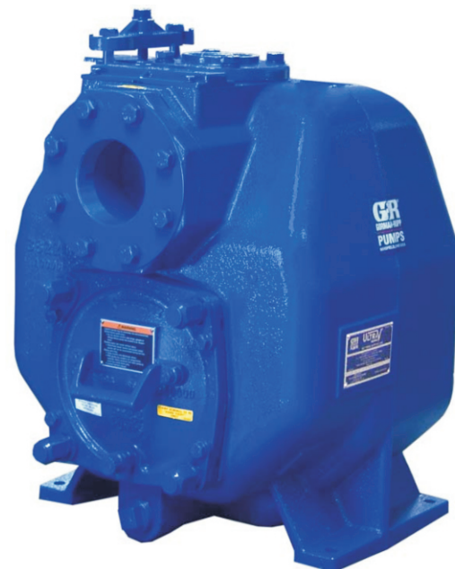
Показан с дополнительными фланцами (стандарты ASA или DIN).

* В случае если насос эксплуатируется при повышенном давлении и температуре, проконсультируйтесь с представителем ООО «ВТ Инженерные Системы».